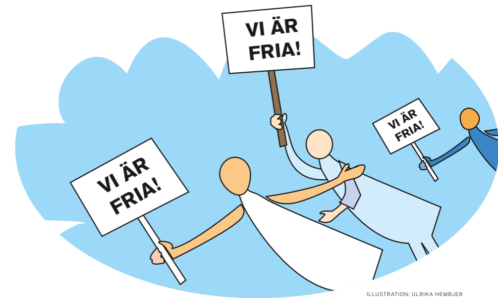
ILLUSTRATION: ULRIKA HEMBJER

Valfriheten gäller alla sjukgymnaster, oavsett om de arbetar på en offentligt