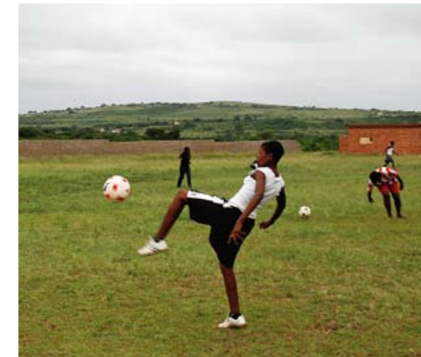
Perspektiv på HIV. Under en 90-minuters fotbollsmatch hinner 400 unga människor mellan 15 och 24 år världen över smittas av HIV. (Källa: UNICEF)

”Man måste ta hänsyn till att många har dåligt med mat och risken med hård träning är att de blir infektionskänsliga.”