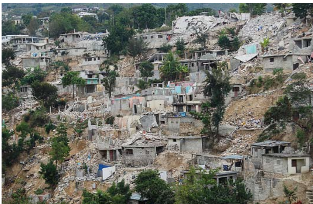
Allt är raserat. Många människor ligger kvar under rasmassorna, ännu saknas 100 000 personer.

”Nu finns det så många människor med rörelsehinder här så det kommer att bli omöjligt att diskriminera dem.”