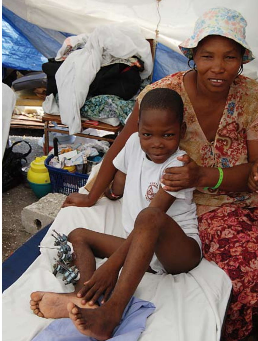
Opererad. En pojke har fått sitt underben opererat och fixerat vilket gläder hans mor. Många andra väntar fortfarande på hjälp.

plundring gjorde det svårt att nå fram till katastrofområdet.