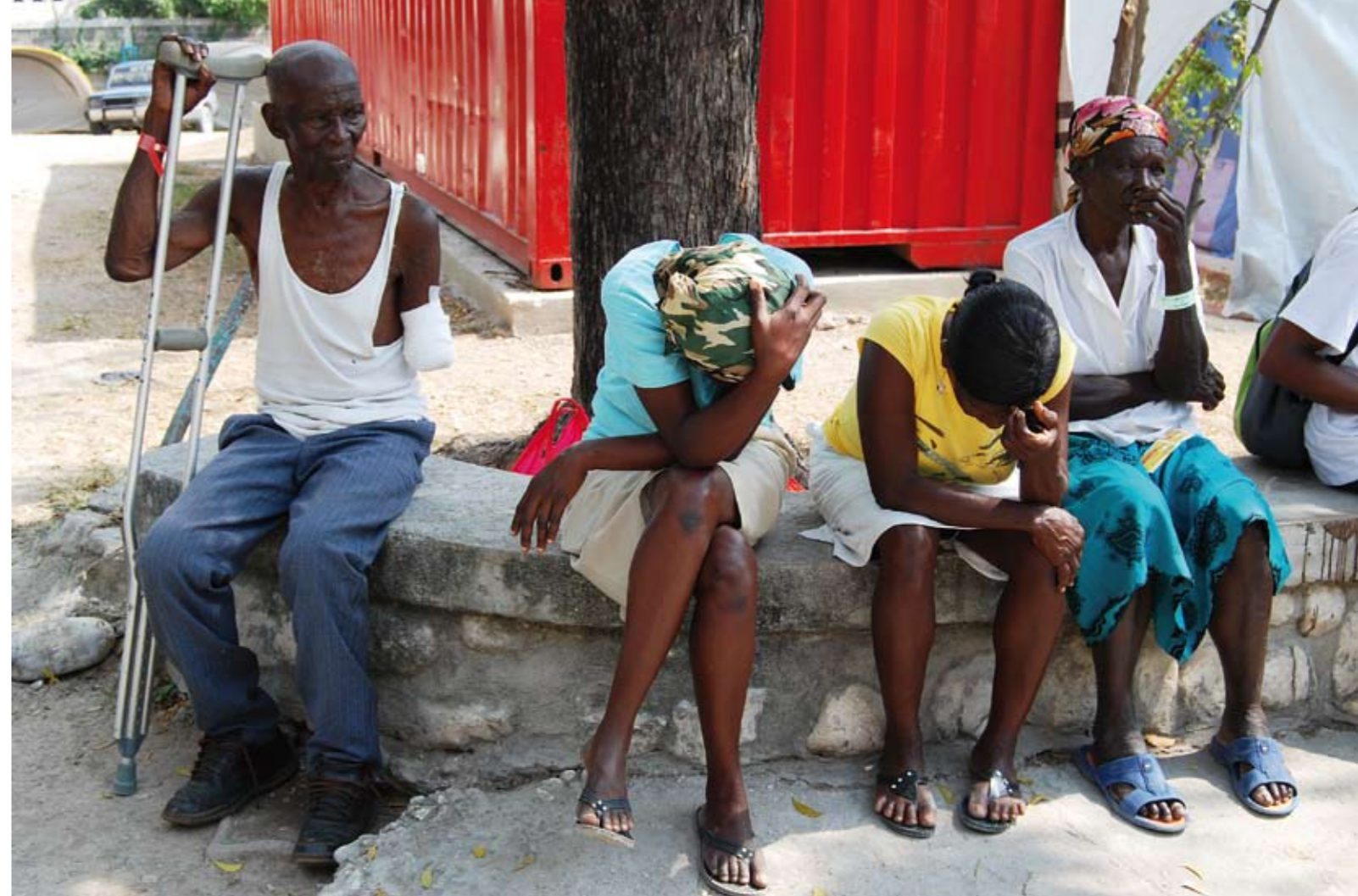
Lidande folk. Haitis folk har tidigare drabbats av orkaner och tropiska stormar. Men aldrig har nöden varit så stor som efter jordbävningen i januari.