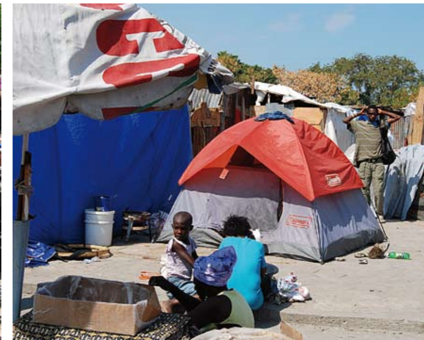
Tältläger. Provisoriska tältläger finns utspridda överallt, men när regnperioden börjar i april ger de inte mycket skydd.