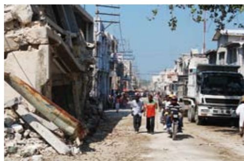
Gatuliv. Livet återvänder sakta till gatorna, men då rasrisken består håller sig folk mest utomhus.