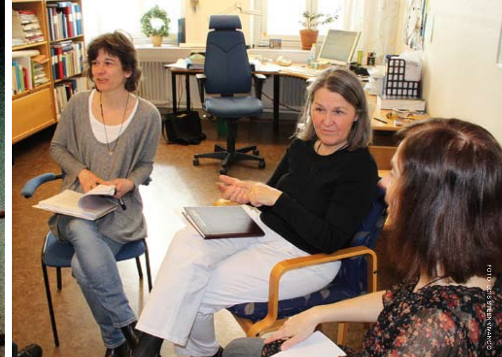
Teamet en styrka. ”Vi har arbetat mycket med att utveckla samarbetet mellan professionerna. Det är vår starka sida.”