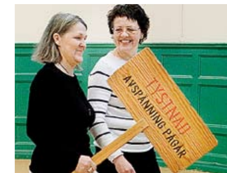
Avspänning på gång.

Det kan handla om att avbryta en övning som inte känns bra eller att vara kvar i övningen och hantera jobbiga tankar och känslor som väcks.