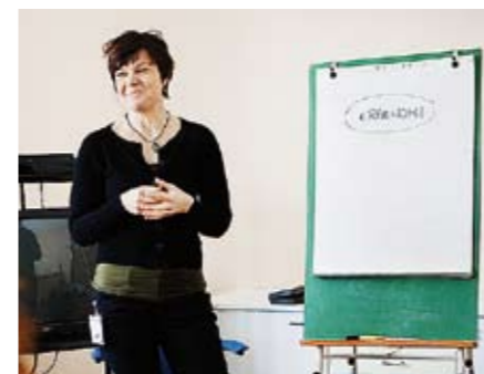
Genomgång i ergonomi.