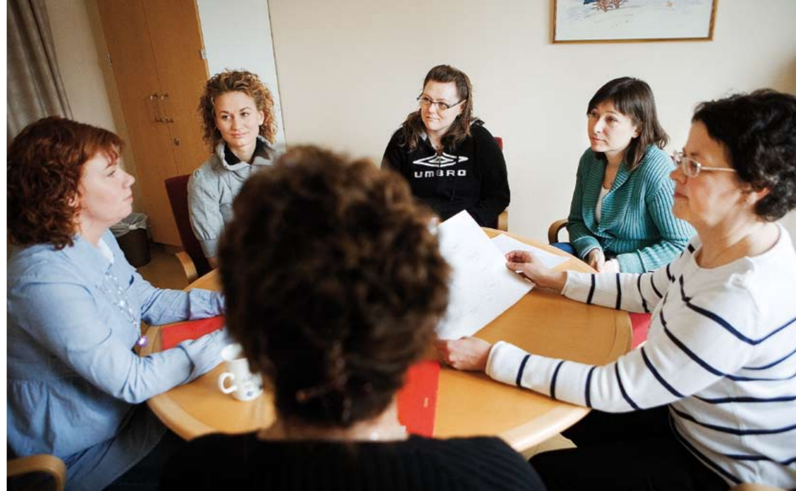
Samtal om livskompassen. Livskompassen är ett cirkeldiagram där individen med smärta står i mitten. Runt omkring individen finns elva livsområden: familj, självomsorg, arbete med mera. Patienten väljer själv vilka områden man vill arbeta med under programtiden.

– Jag säger till patienten att ”min roll är inte att ge dig en förklaring, min uppgift är att få dig att reflektera”. Förhållningssättet i Basal kroppskänedom stämmer väl överens med ett kognitivt och accepterande förhållningssätt till sig själv. Här uppmanar vi patienterna att uppmärksamma hur det känns och ta eget ansvar för sitt agerande i övandet.