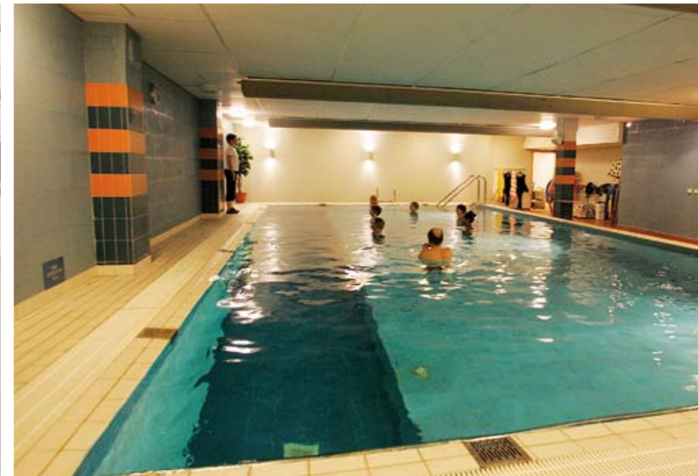
Lugnt och varmt. Det är lunchtid, men några personer har sökt sig till värmen i varmvattenbassängen för ett rogivande qigongpass.

– Den som kommer till oss som patient ska vara det så kort tid som möjligt och sedan slussas vidare in i friskvården. Miljön är medvetet planerad så att man ständigt ska stimuleras i sin längtan att gå från det sjuka till det friska. När man