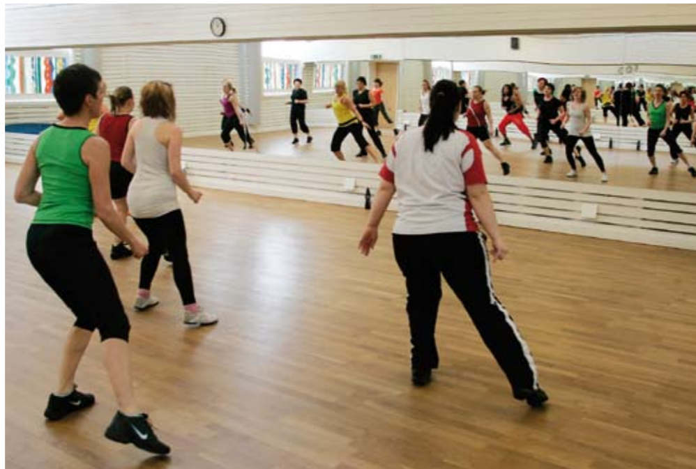
Välbesökt anläggning. Helex i Luleå tog förra året emot 170 000 besök. Dagens aerobicspass är också välbesökt.

Något som hon arbetat mycket för är att alla oavsett bakgrund kommunicerar ett hälsofrämjande budskap till patienter och kunder. I början tog det lite tid att jämka samman sjukgymnasterna och friskvårdspersonalen.