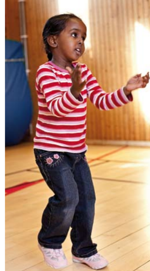
Viktigast. Rörelseglädje är det allra viktigaste under mamma/barn-gympan i Hammarkullen.

”Det känns bra att komma hemifrån och det är roligt för barnen med alla rörelserna.”